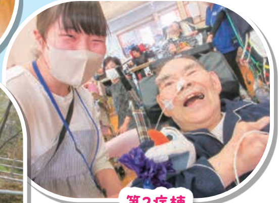
第2病棟 いつものボランティアさん と一緒に行事参加