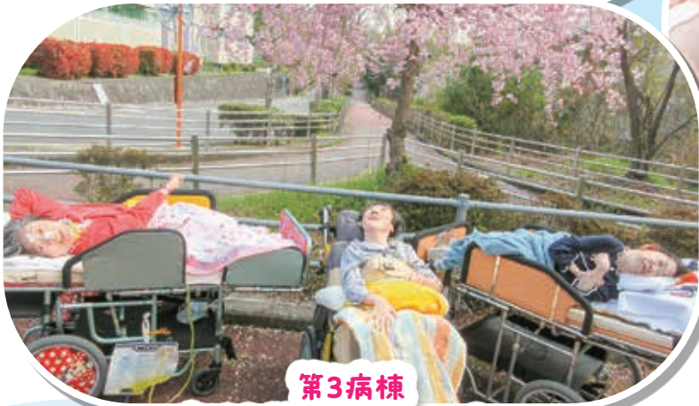
第3病棟 春はお散歩気持ちいいなあ