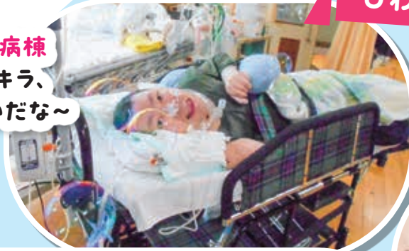
第1病棟 キラキラ、 きれいだな～