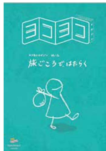
学生向けに作成した「ヨコヨコ」の冊子

続いて、魅力発信としてのヨコヨコというメディア「note」というメディアプラットフォームを利用し、福祉ではたらく人へのインタビュー等をととした魅力発信「ヨコヨコ」をはじめました。大津市内の障害福祉現場で働く人たちのインタビューを通して魅力発信に取り組んでいます。コンセプトとしては、「障害福祉の関係人口を増やす」ということを意識しています。「就職」という人生の大きな決断をいきなり迫るのはかなりハードルが高いため、ダイバーシティ&インクルージョンということに関心を持っている学生に「障害福祉」「障害者」を意識してもらい「関係人口」になってもらうことから始めることにしました。