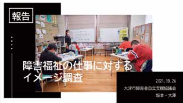
事業所向け福祉の魅力に関する報告会資料（令和3年10月）

障害福祉のしごとが、福祉学生・非福祉学生から実際にどのようなイメージをもたれているのか就職に対してどんな意識を持っているかを把握するため、